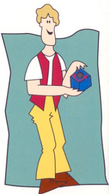
Drej røret i Buster Cube for at ændre sværhedsgraden af øvelsen. Servér Buster Cube for hunden med hullet opad.

For at gøre rengøringen mere effektiv kan røret trækkes ud af terningen. Når røret skal sættes i terningen igen, skal du være opmærksom på, at taperne i røret skal passe i terningens åbning. Røret drejes på plads med et kraftigt drej "med uret". Røret er sat rigtigt på plads, når det kun kan drejes mellem "max." og "min.".