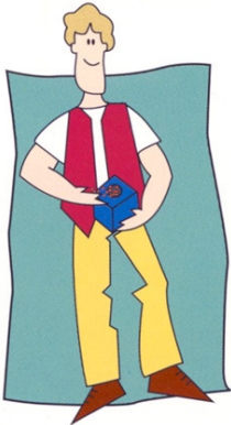
Kom en spiseskefuld tørfoder i Buster Cube.

Buster Cube er inddelt i flere kamre, som fyldes med tørfoder i form af piller. Disse frigives ganske langsomt i takt med, at din hund aktiverer terningen med snuden eller poterne. Ved at dreje røret mod henholdsvis "max " og "min " kan du justere sværhedsgraden m.h.t., hvor let foderet skal komme ud af terningen.